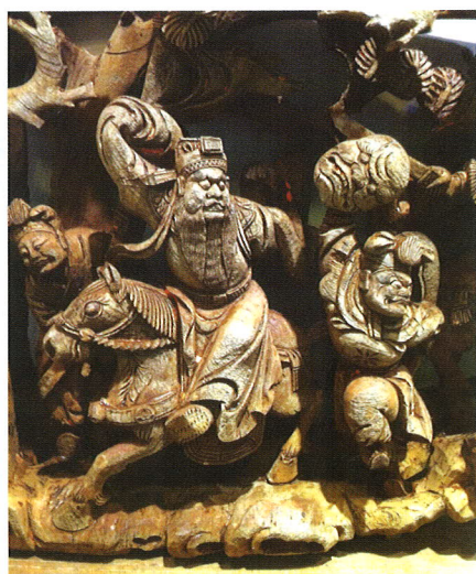
民間把「割鬚棄袍」故事造成窗框裝飾。

敵，西涼兵來得勢猛，直衝入曹營來捉拿曹操。曹操慌忙逃命，在亂軍中祇聽到西涼軍大叫：「穿紅袍的是曹操！」曹操聽着，立刻在馬背上將紅袍脫下扔掉，跟着又聽得追兵大叫：「長鬚者是曹操！」曹操聽着大驚，急忙用佩刀把長鬚割下。西涼軍將曹操割鬚之舉報告馬超，馬超下令西涼兵再大叫：「短鬚者是曹操！」曹操嚇得連忙扯着旗角包頸而逃才得以保命，這就是有名的割鬚棄袍的故事。 ㊦