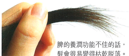
脾的養潤功能不佳的話，髮會很易變得枯乾脫落。

先說脾臟。中醫學指脾為後天之本，亦是氣血生化之源。脾的主要生理功能之一是運化水谷精微，相當於負責吸收和輸送水液、電解質及營養物質至全身。作為氣血生化之源，脾將水谷精微提供給有關組織生化氣血。由於頭髮的正常生長發育有賴於水谷精微及